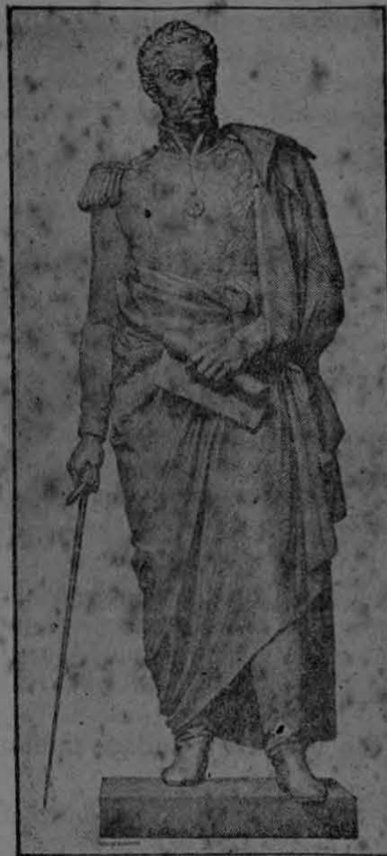
Bolívar, Padre americano. (Según Tenerani)

Pero que no les perviertan y les estraguen el gusto, que sólo en aplicaciones a formas serenas de paz debe complacerseles, describiéndoles a este Grande Hombre de América sólo como un General intrépido, ganador de batallas difíciles, porque ellas no fueron propiamente el fin perseguido por los titánicos esfuerzos que le consumieron temprano la vida, sino el camino dramático a lo largo del cual, por entre campos de sangre, tenía que llegar a la realización de su ideal libertador y creador. Y para que ninguna duda les quede a los niños de esta comarca de que no hemos erigido aquí esta estatua para complacencias de admiración de genio guerrero—uno más entre los muchos que han figurado en la trágica historia del mundo—he aquí las palabras con que el Libertador de mi Patria, en el Mensaje al Congreso de