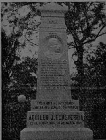
MONUMENTO A AQUILEO

PARA la moza garrida; para el mocetón esbelto; para la vaca lechera, y para el potro azulejo; para el vendedor de leña; para el audaz curandero; para el patas y la segua, la llorona y el cadejos; para el valor temerario de los "sencillos labriegos" que desnudan sus cutachas por grito más o de menos, y se baten con bravura en descomunales duelos; para las verdes montañas, para los altivos cerros; para los dulces paisajes con que alfombrara este suelo el solícito agasajo de nuestro verdor eterno, tuvo una nota su lira, tuvo su lira un acento delicado, cariñoso, fragante, nítido y fresco.